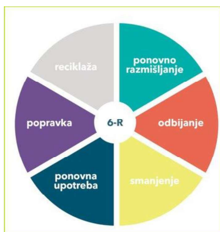
Slika br. 2: Prikaz 6-R koncepta cirkularne ekonomije