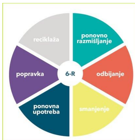
Slika br. 2: Prikaz 6-R koncepta cirkularne ekonomije